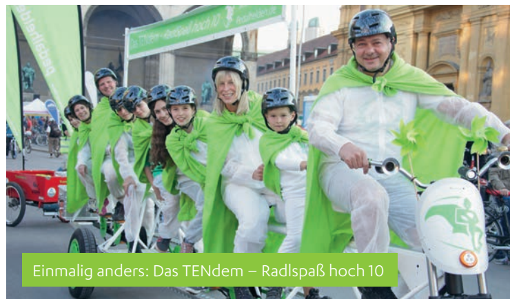
Einmalig anders: Das TENdem – Radspaß hoch 10