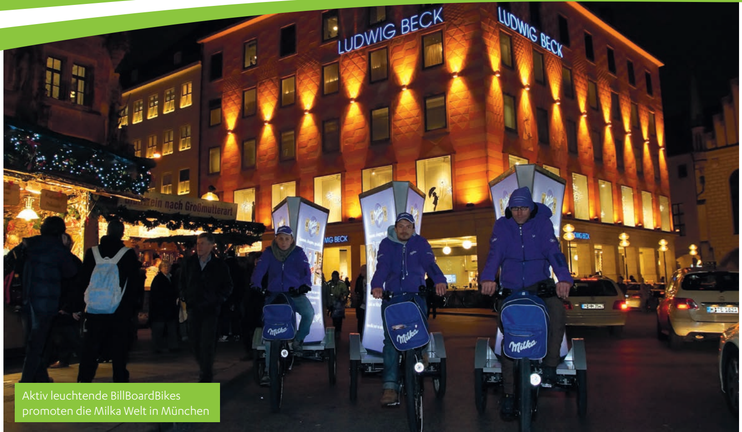
Aktiv leuchtende BillBoardBikes promoten die Milka Welt in München

Sympathisch, sportlich, spektakulär! Aufleuchten, auffallen, austeilen!