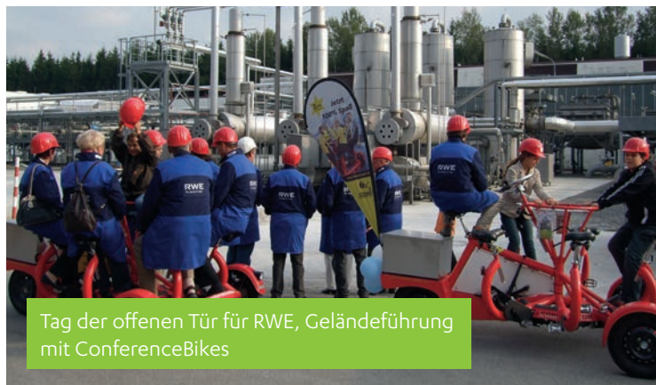
Tag der offenen Tür für RWE, Geländeführung mit ConferenceBikes