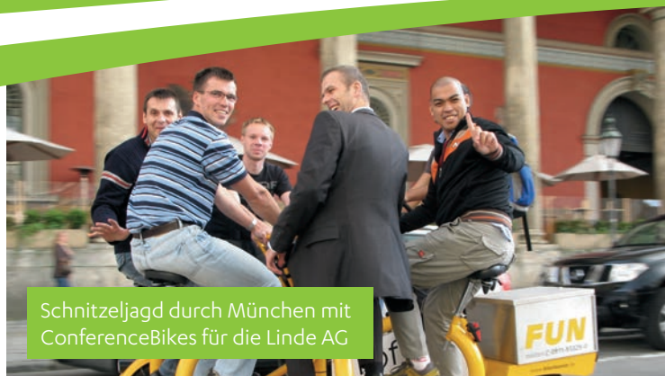
Schnitzeljagd durch München mit ConferenceBikes für die Linde AG