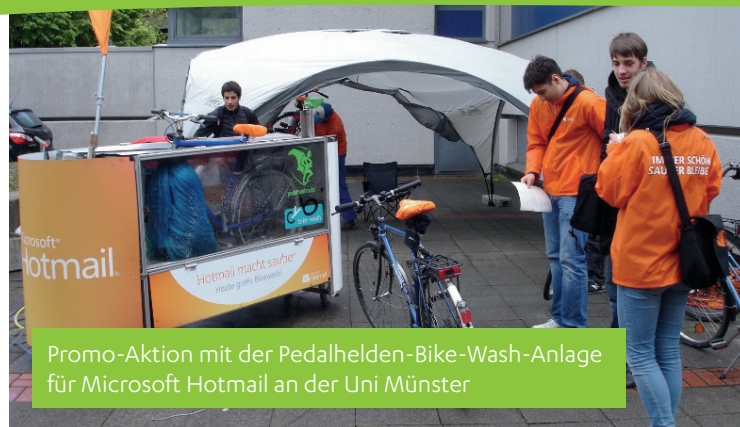
Promo-Aktion mit der Pedalhelden-Bike-Wash-Anlage für Microsoft Hotmail an der Uni Münster