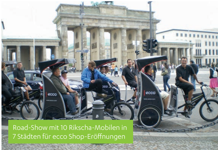
Road-Show mit 10 Rikschas-Mobilen in 7 Städten für ecco Shop-Eröffnungen